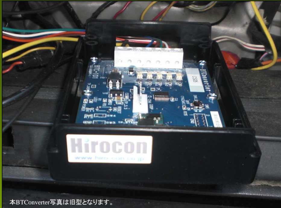
本BTConverter写真は旧型となります。